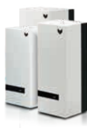
QM Quattro 60/100/150 L