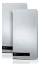
QMC Quattro+ 100/150 L