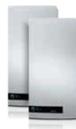
QM Quattro+ 100/150 L